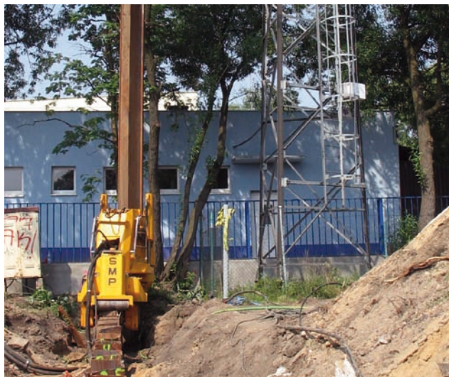
Fot. 4. Instalacja grodzic stalowych metodą wciskania