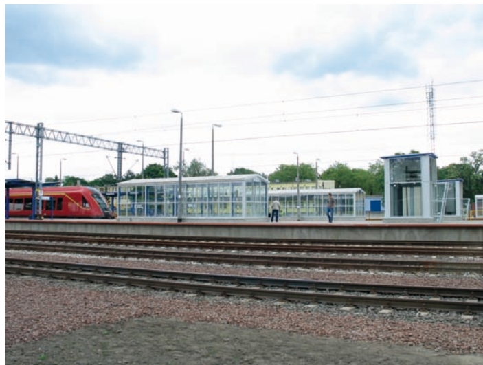
Fot. 10. Perony stacji Kozłuszki po modernizacji

mentów palowych, z czego 180 szt. w rejonie stacji Kozłuszki. Roboty fundamentowe zakończono w kwietniu 2008 r.