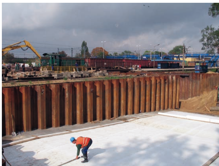
Fot. 6. Zabezpieczenie odcinka tunelu na etapie wykonania płyty dennej

toringiem poziomym wibracji. W ten sposób, bez uszkodzenia budowli i urządzeń kolejowych, zakończono na początku sierpnia 2008 r. wszystkie roboty związane z instalacją ściany stalowej (fot 6, 7, 8).