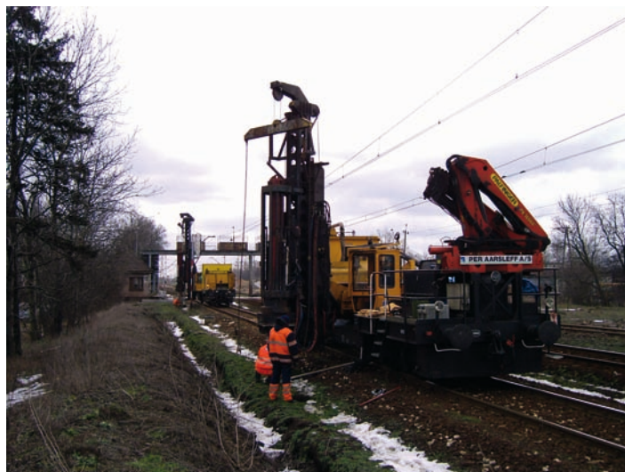
Fot. 11. Instalacja prefabrykowanych pali fundamentowych pod słupy konstrukcji wsporczej trakcji kolejowej