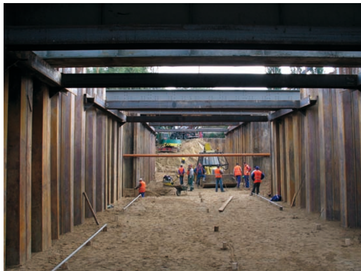
Fot. 7. Faza wykonania wykopu docelowego zabezpieczonego ścianami szczelnymi