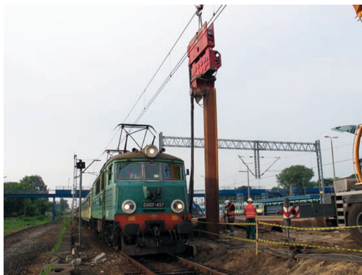
Fot. 2. Instalacja stalowej ścianki szczelnej metodą wibracyjną przy czynnym torze kolejowym