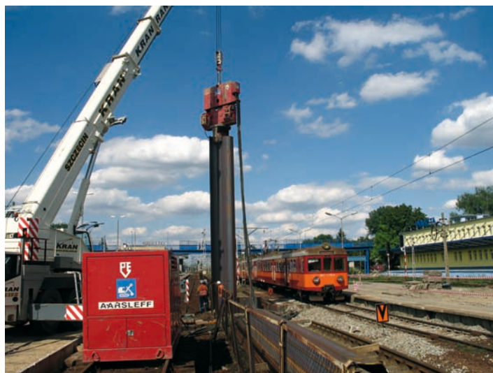
Fot. 3. Instalacja grodzic metodą wibracyjną wzdłuż czynnego toru kolejowego