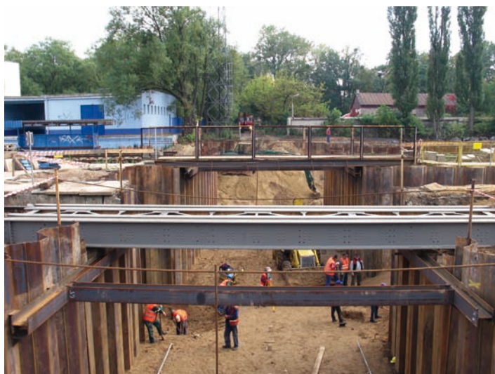
Fot. 8. Zabezpieczająca ścianka szczelna oraz tymczasowa konstrukcja kolejowa w fazie budowy