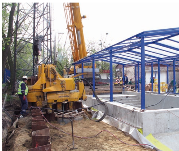
Fot. 5. Bezwibracyjny demontaż grodzic bezpośrednio przy wybudowanej konstrukcji wejścia do tunelu.