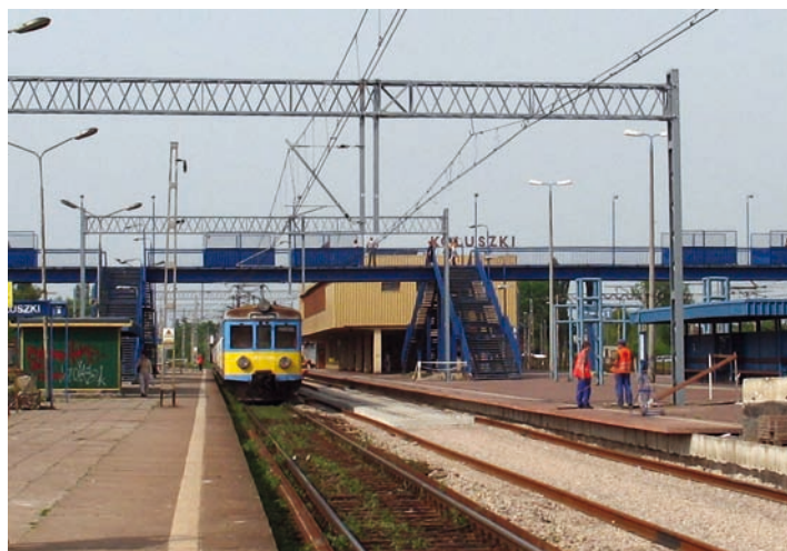
Fot. 1. Dotychczasowe przejście dla pieszych