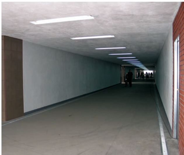
Fot. 9. Efekt prowadzonej budowy – przejście oddane do eksploatacji